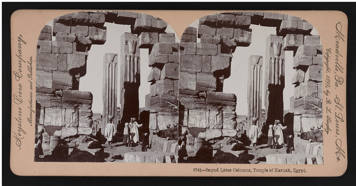
埃及卢克索卡纳克（Karnak， Luxor）神庙的圣莲和圣莎草柱

这些真理，象生命本身一样伟大，却简而又简，如人最简单的心。用这些真理去满足饥渴吧。”